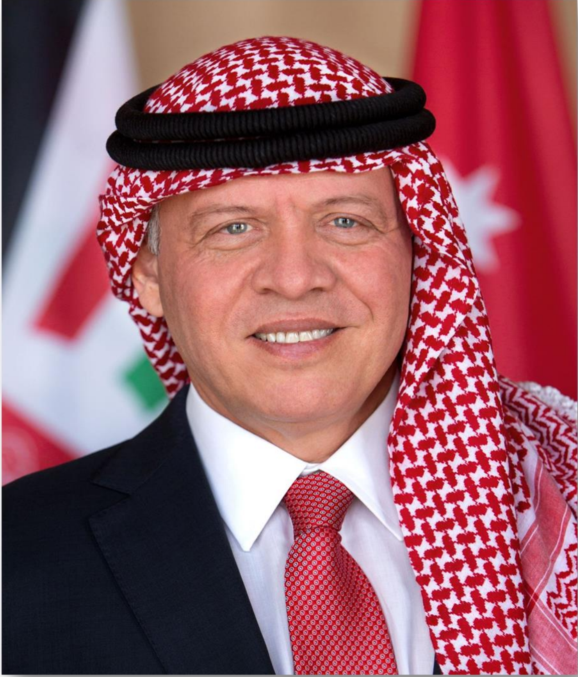
حضرة صاحب الجلالة الهاشمية الملك عبد الله الثاني بن الحسين حفظه الله ورعاه